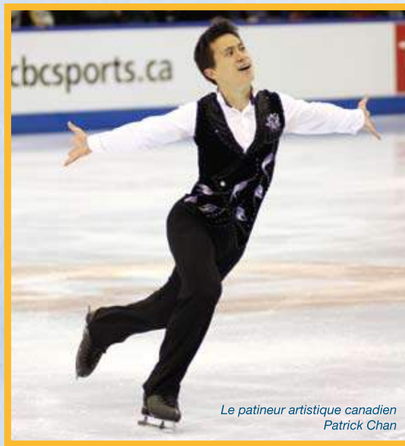
Le patineur artistique canadien Patrick Chan