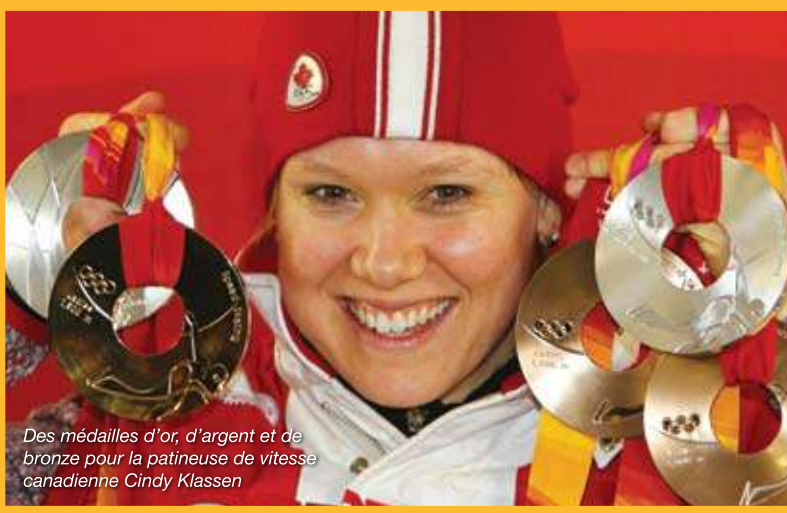
Des médailles d'or, d'argent et de bronze pour la patineuse de vitesse canadienne Cindy Klassen

Le bronze est un alliage de cuivre, habituellement combiné à l'étain. L'utilisation du bronze a eu des effets considérables sur le développement de la civilisation. La période entre 3500 et 1200 avant l'ère chrétienne est nommée âge de bronze parce que la découverte de l'alliage a grandement amélioré la fabrication d'outils, d'armes, d'armures et de matériaux de construction. Le bronze comporte toujours nombre d'applications dans la fabrication de cloches, d'instruments de musique et de médailles. Les pièces en bronze servent également dans les agrafes pour paliers, les connecteurs électriques, les ressorts et les matériaux de couverture.