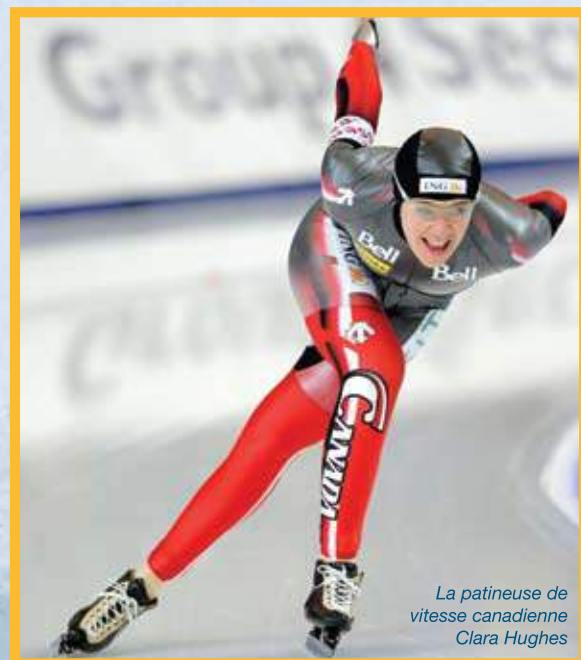
La patineuse de vitesse canadienne Clara Hughes

De la glace. de la formation. des muscles. de la passion. de la détermination... voilà ce qu'il faut aux patineurs pour être les meilleurs. Et il y a en plus les équipements. les sites... L'EXPLOITATION MINIÈRE EST AU FOND DES CHOSES!